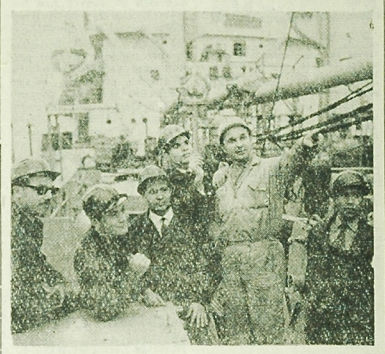
W ciągu roku szkolnego 1966/67 przez Česką Słowację im. Urloho przewiozło się prawie 100 tysięcy pracowników zagranicznych z 10 krajów. W tym po raz pierwszy ze ZRA i Francji.

starca się żywności i lekarstwa. W północnych, zachodnich i wschodnich rejonach Meksyku rozniszczono zostało wiele dróg i kolei. Na wybrzeżu Zatok Meksykańskiej wyłusm grozą duże wielkie rzeki Panuco i Papalapan. W związku z tym wzdłuż brzegów wyszły, położone nad ich brzegami miejscowości.