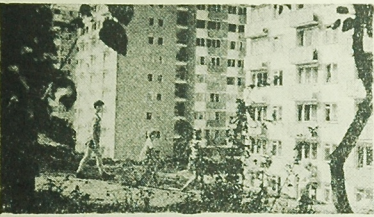
Z WĘDRÓWKI PO KRAJU Zielona Góra — fragment osiedla Ważów.